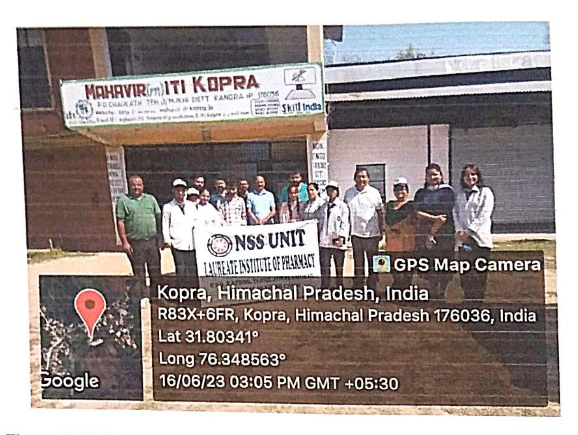
Figure: NSS Volunteer at Mahavir ITI Kopra for health checkup and awareness.